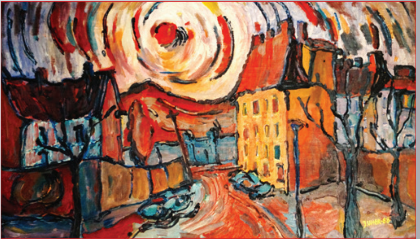
Dvory starej Bratislavy, olej, 68 x 41 cm, 1988