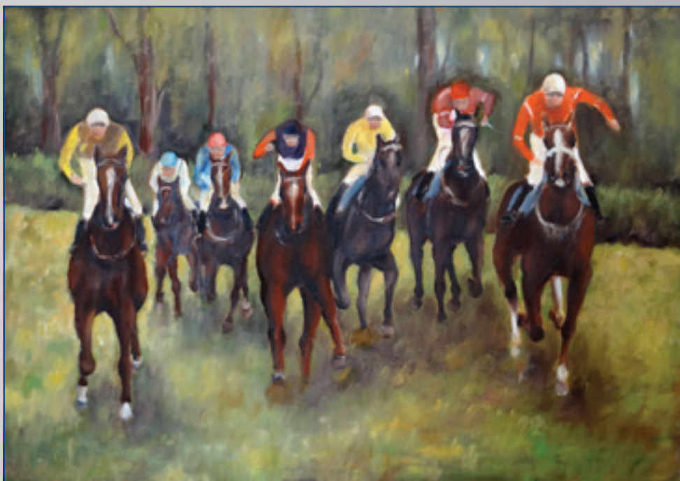
Preteky I., olej, 70 x 50 cm, 2009