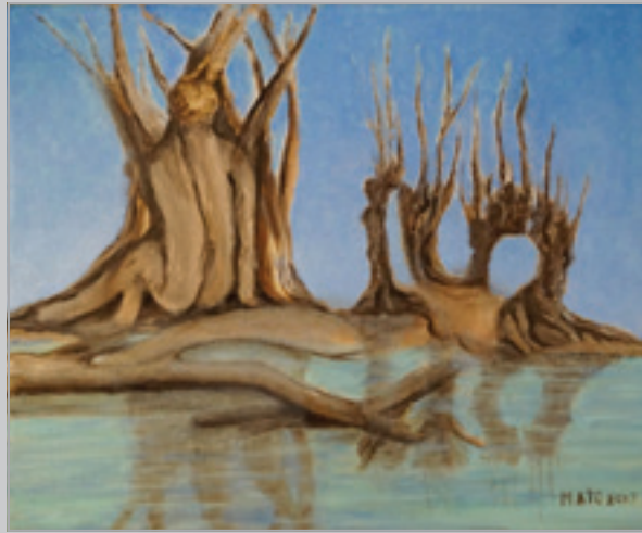
Pretelenie , olej, 30 x 20 cm, 2017