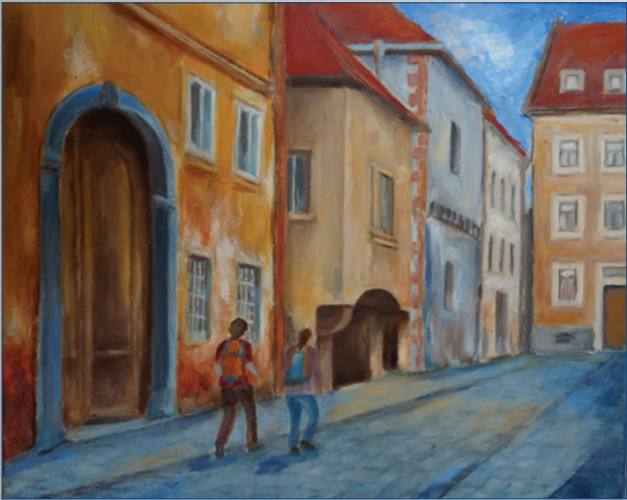
Kapitulská ulička , akryl, 50 x 40 cm, 2016