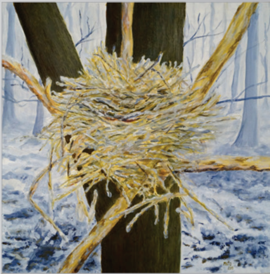
Zamrznuté hniezdo , olej, 40 x 50 cm, 2015