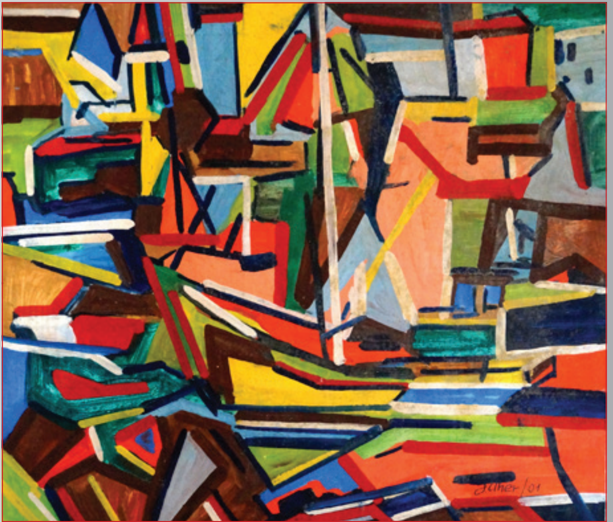
Prístav , olej, 38 x 30 cm, 2001