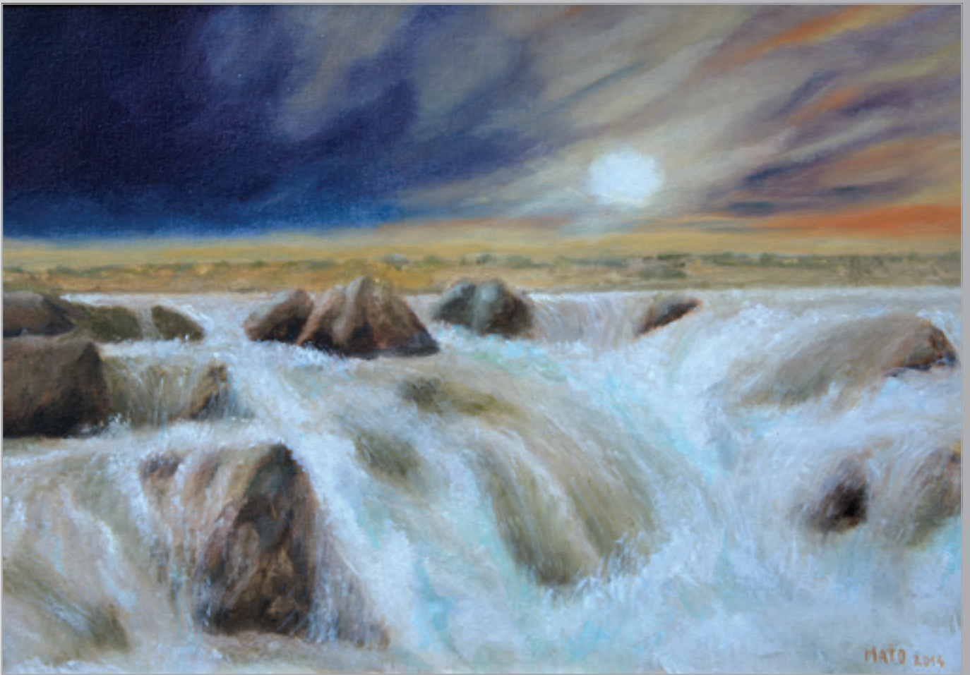
Riava , olej, 50 x 30 cm, 2014