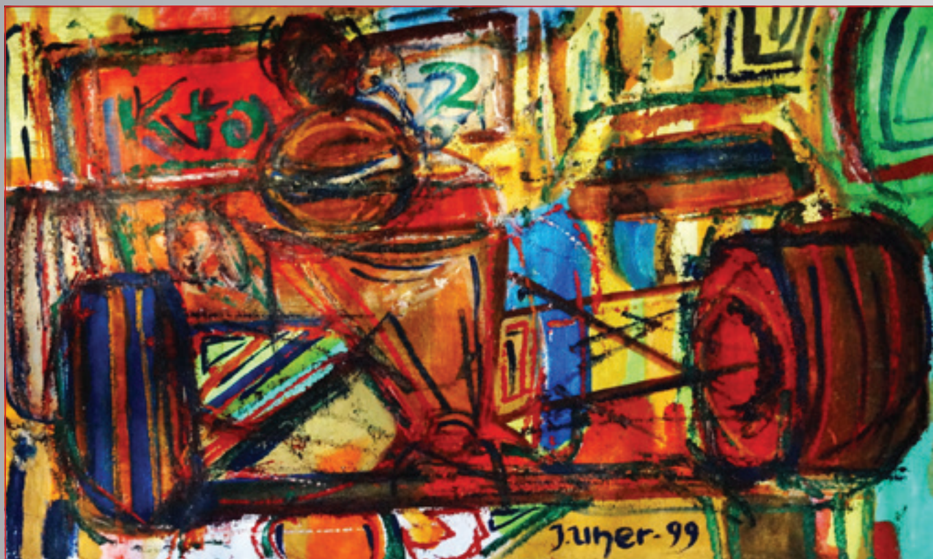
Formula , akryl, 51 x 36 cm, 1999