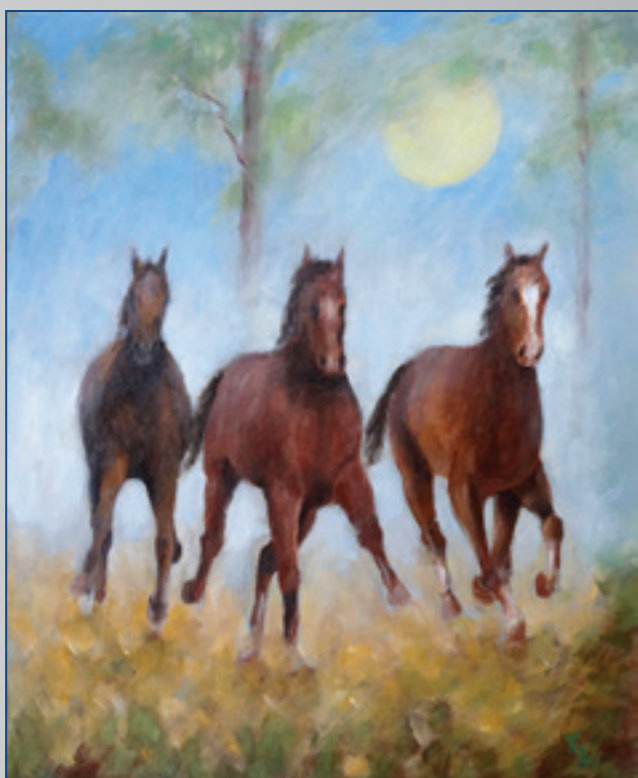
Trojka v rannej hmle, akryl, 50 x 60 cm, 2015