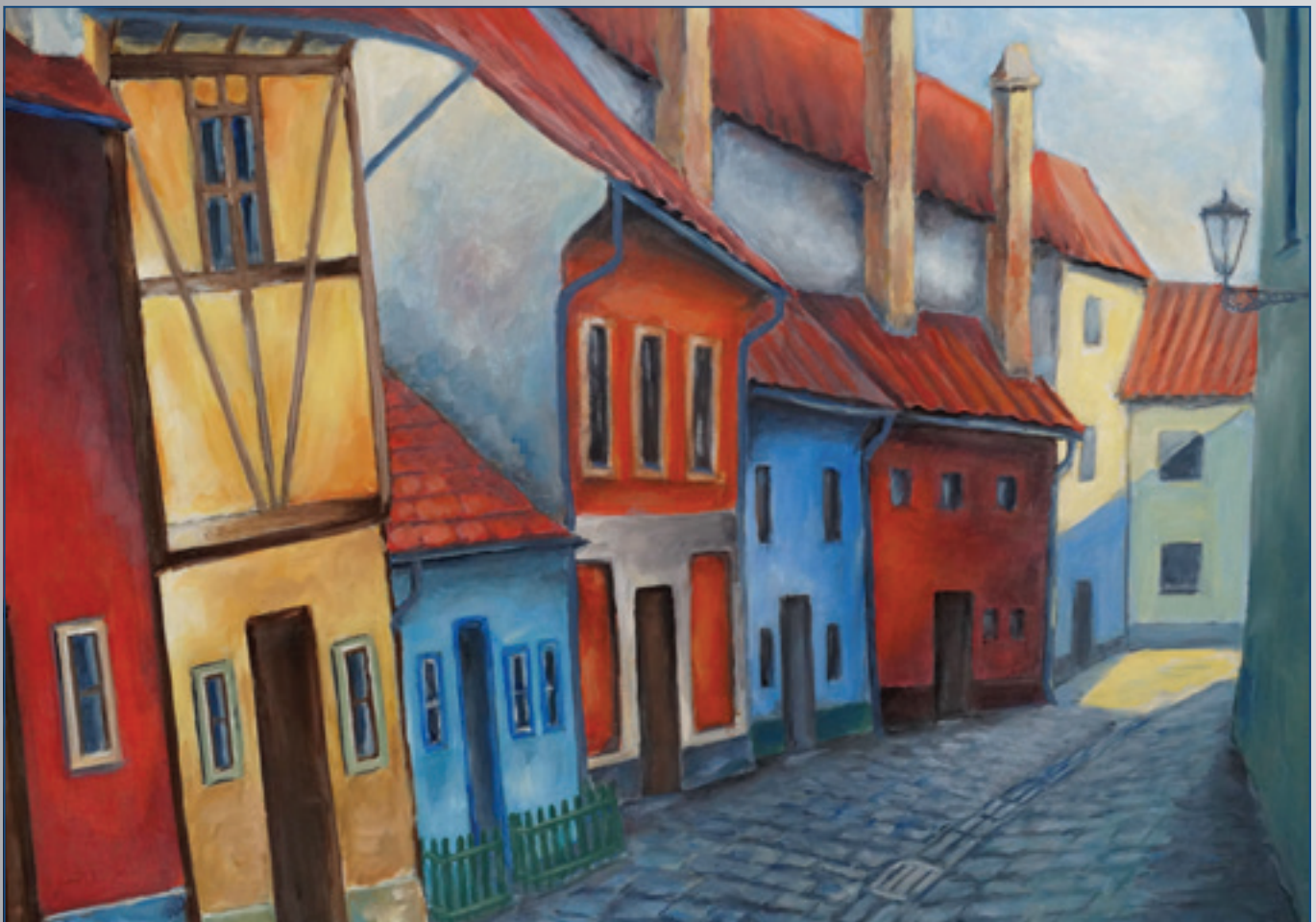
Zlatá ulička v Praze , akryl, 60 x 50 cm, 2008