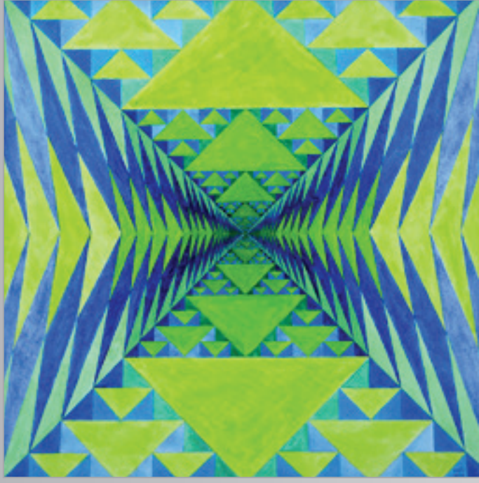
Smerom k počiatkom I. , akryl, 60 x 60 cm, 2013