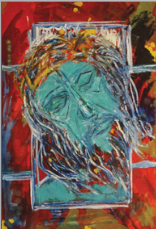
Môj Ježiš Kristus , akryl, 38 x 57 cm, 2007

Pravidelne sa zúčastňoval súťaže neprofesionálnych výtvarníkov Výtvarné spektrum a takmer vždy postúpil do celoštátneho kola a získal ocenenie.