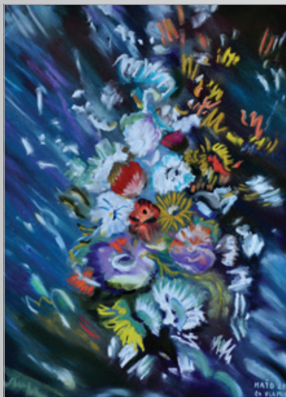
CO M.Vlaminck BUNCH OF FLOWER pastel, 30 x 40 cm, 2014