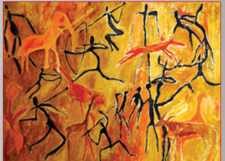
Oči Afriky - Hľadanie identity II., olej, 70 x 50 cm, 1997