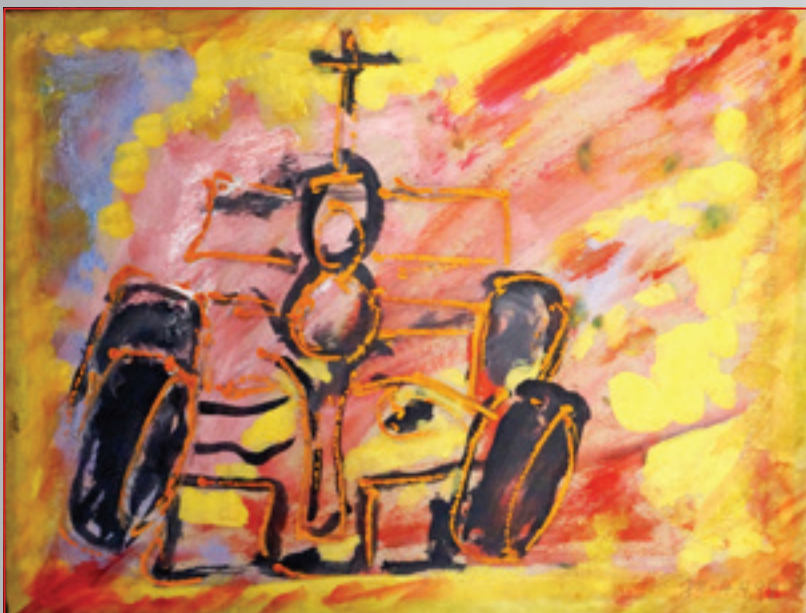
Formula , akryl, 32 x 24 cm, 1999