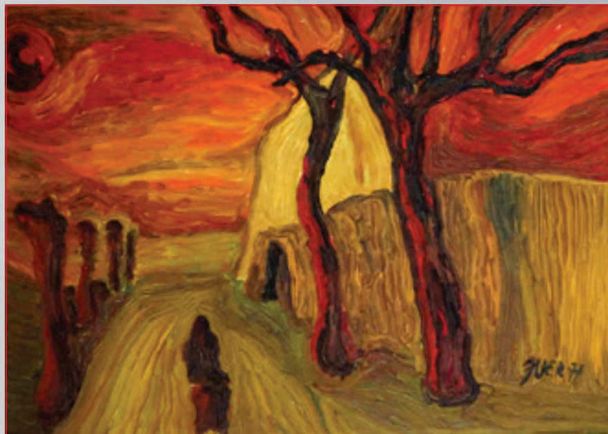
A holé stromy kreslia tázavé krivky olej, 42 x 31 cm, 1997