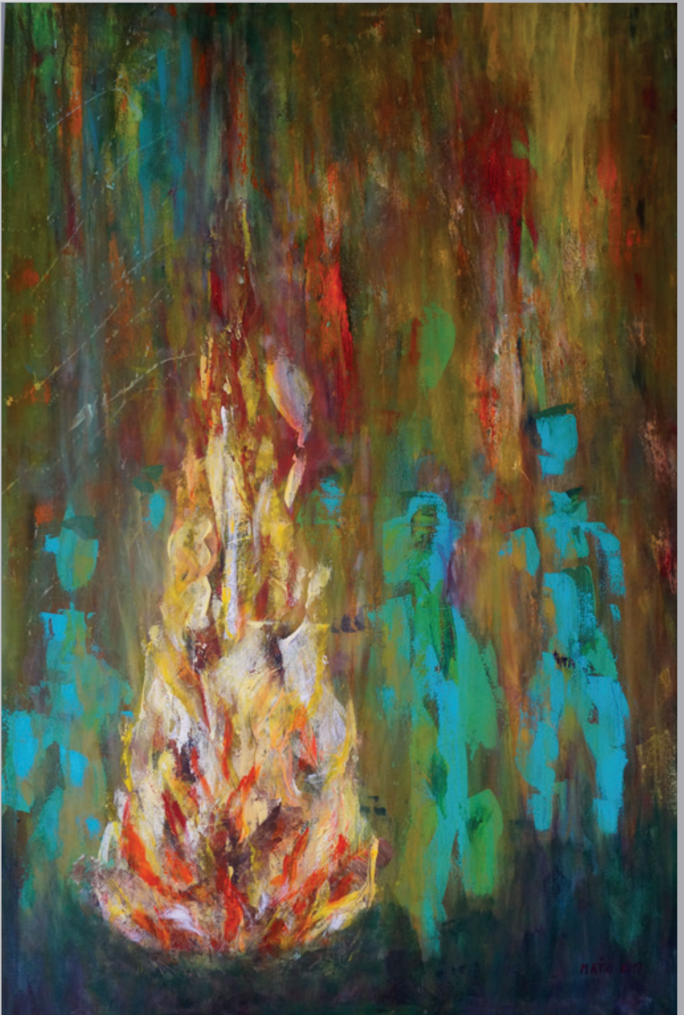
Lesní muži pri vatre, akryl, 75 x 110 cm, 2017