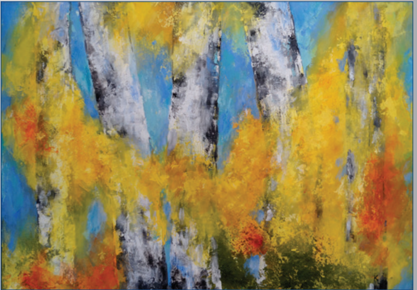
Jar brezovom lese , akryl, 70 x 50 cm, 2017