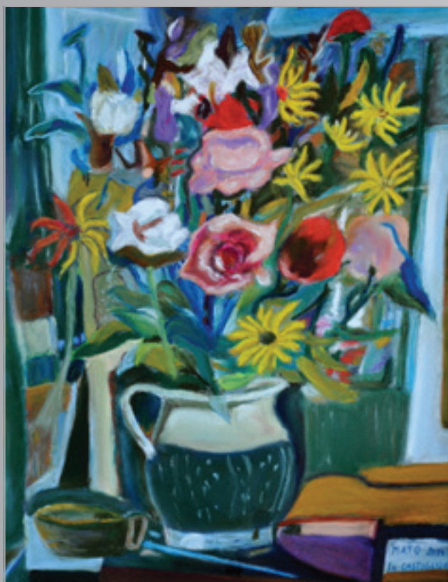
CO E. Castiglione, Zátišie I., pastel, 30 x 40 cm, 2014