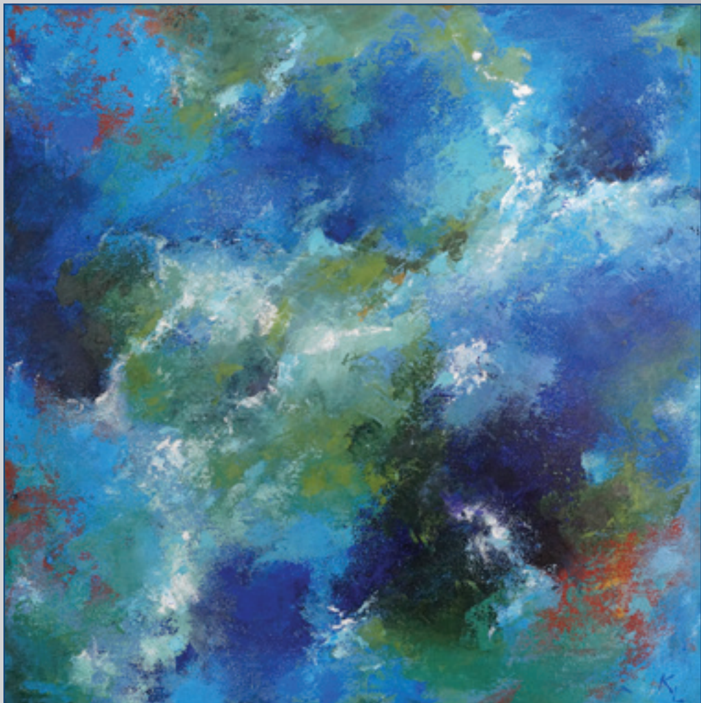
Vírenie , akryl, 50 x 50 cm, 2002