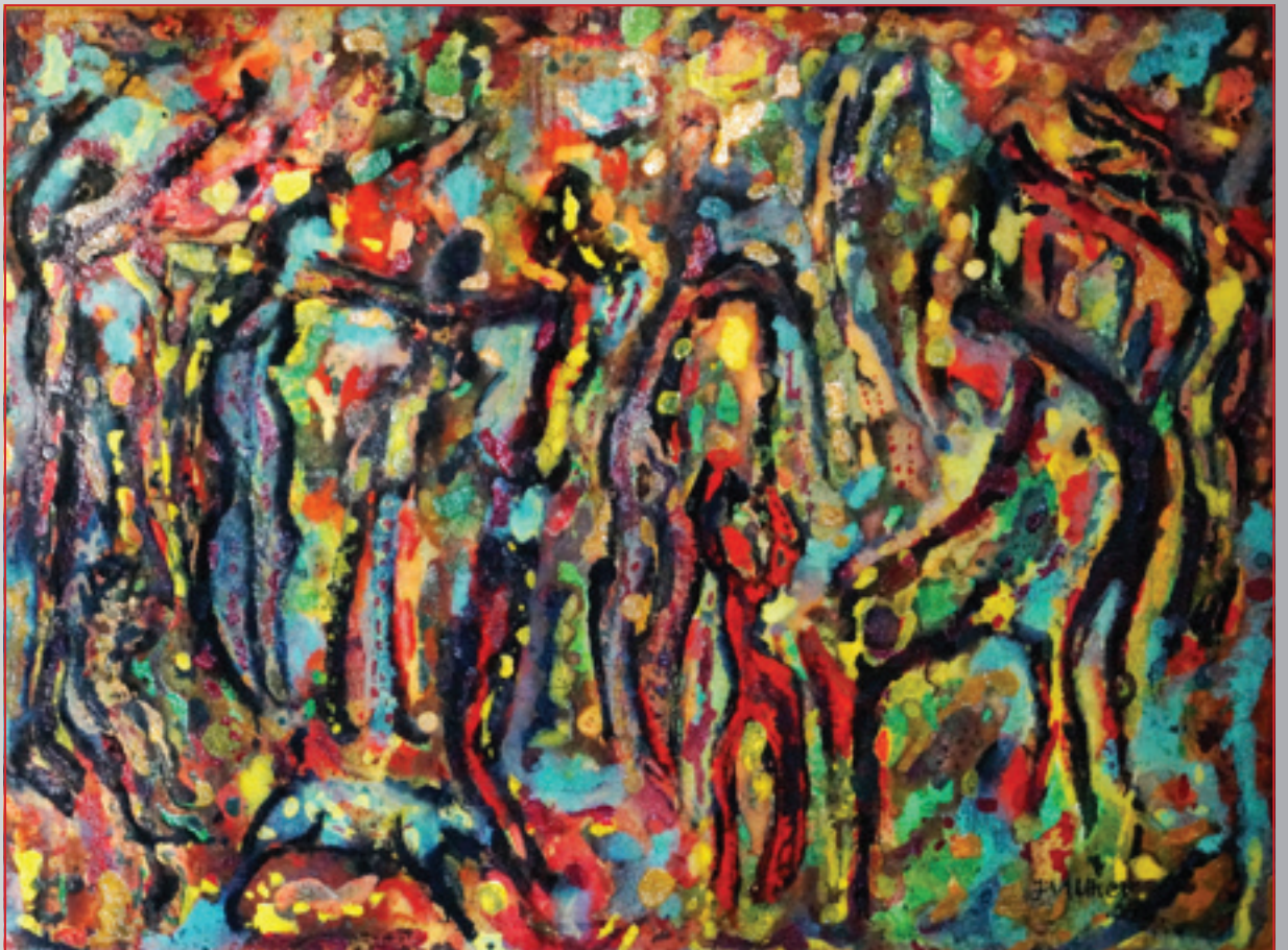
Ozveny podmorských jaskýň , kombinovaná technika, 40 x 30 cm, 2006