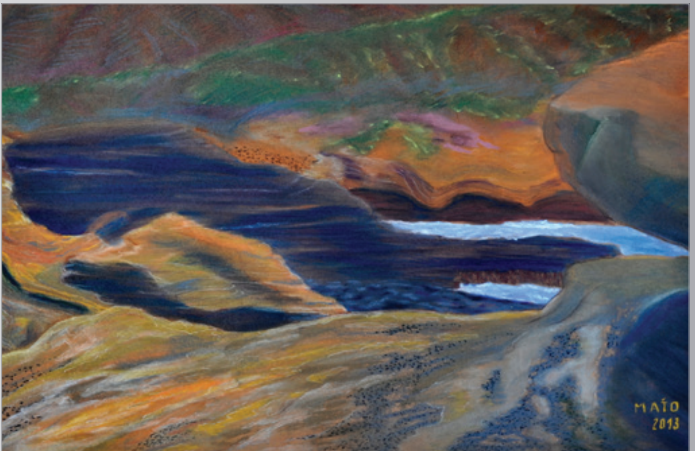
More a čas , pastel, 70 x 50 cm, 2013