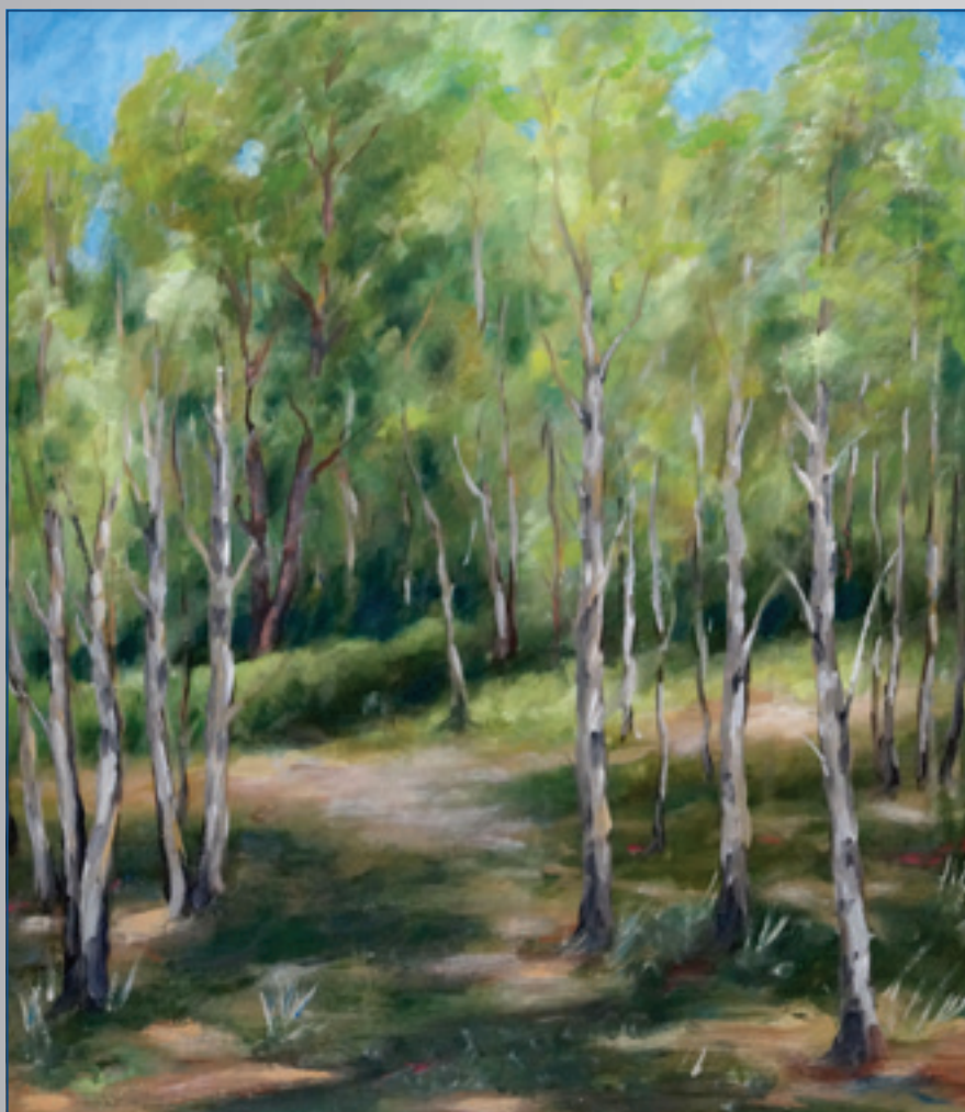
Brezový les I., akryl, 40 x 50 cm, 2007