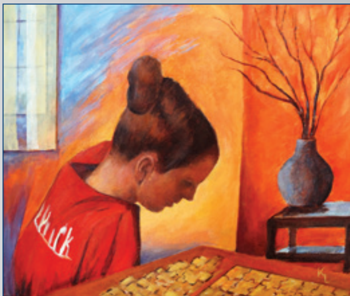
Puzzle girl , akryl, 60 x 50 cm, 2015