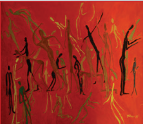
Oči Afriky - Hľadanie identity I., olej, 60 x 55 cm, 1997