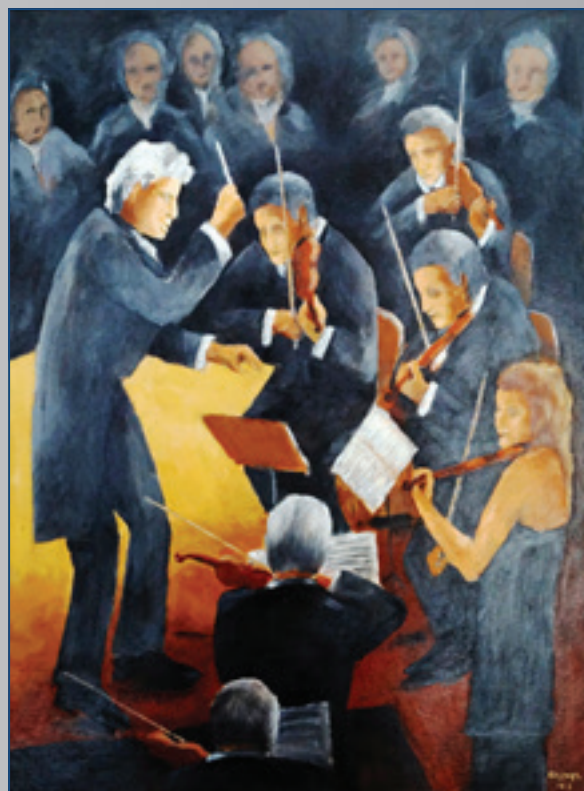
Dirigent bez partitúry , akryl, 50 x 60 cm, 2013