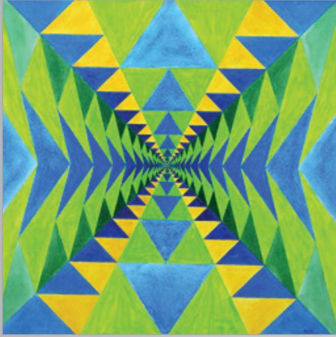
Smerom k počiatkom II. , akryl, 60 x 60 cm, 2013