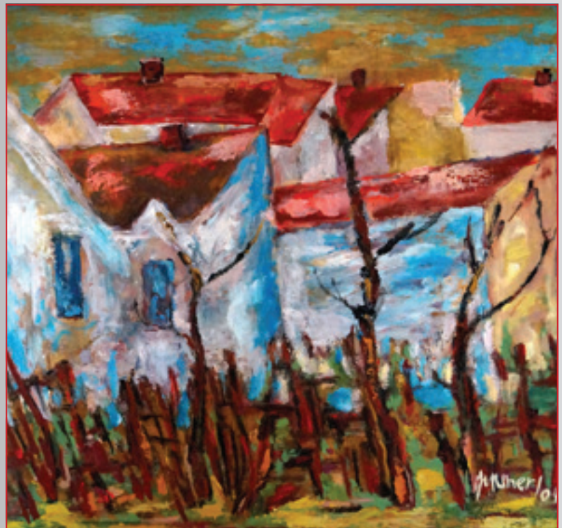
Domčeky na Šancovej ulici , olej, 45 x 35 cm, 2004