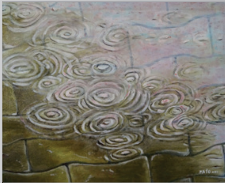
Dážďové kvapky , olej, 50 x 40 cm, 2017