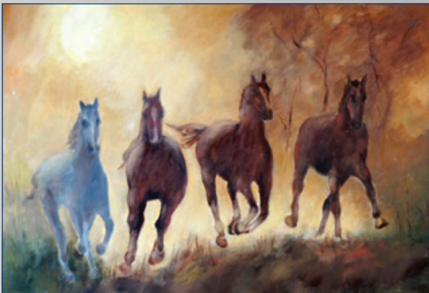
Cválajúca štvorka, olej, 60 x 50 cm, 2012