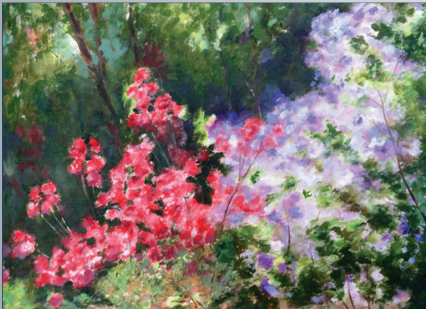
V botanickej záhrade, akryl, 60 x 50 cm, 2012